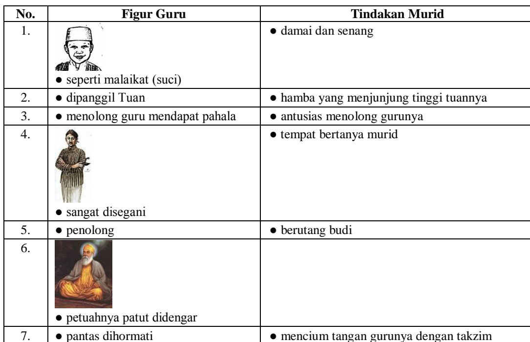
Tabel I Data Figur Guru di Mata Murid pada Karya Sastra Era 1960-an

Dari data di atas dapat dianalisis persepsi murid kepada gurunya yaitu sebagai berikut.