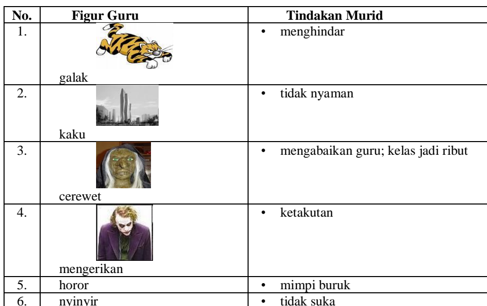
Tabel II Data Figur Guru di Mata Murid pada Karya Sastra Era 2000-an

Dari data di atas terlihat bahwa guru telah dilecehkan, diolok-olok, dan dijadikan cemoohan. Seperti tergambar dalam penganalisisan di bawah ini.