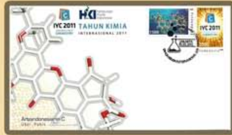
Perangko Edisi Khusus Tahun Kimia 2011