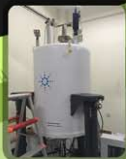
NMR 500 MHz

High Performance Liquid Chromatography (HPLC)