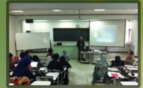
Lecture on Inorganic, 2016